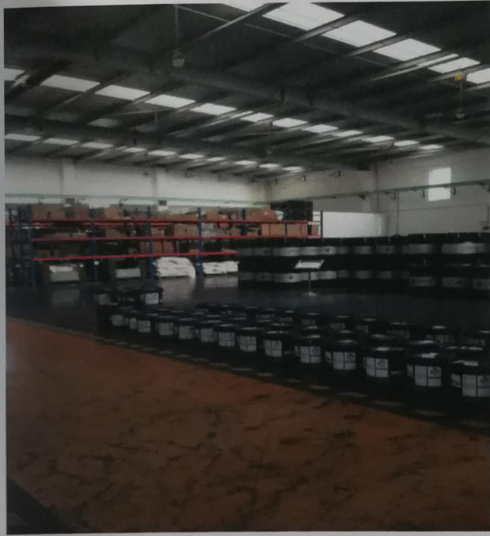
原料仓库 其 VOCs 值 200PPb 左右